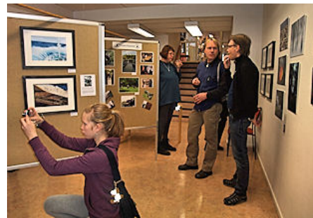
Vernisage Trollbäcken 4.

De fem bidrag som fått mest röster visas på mötet den 17 september.